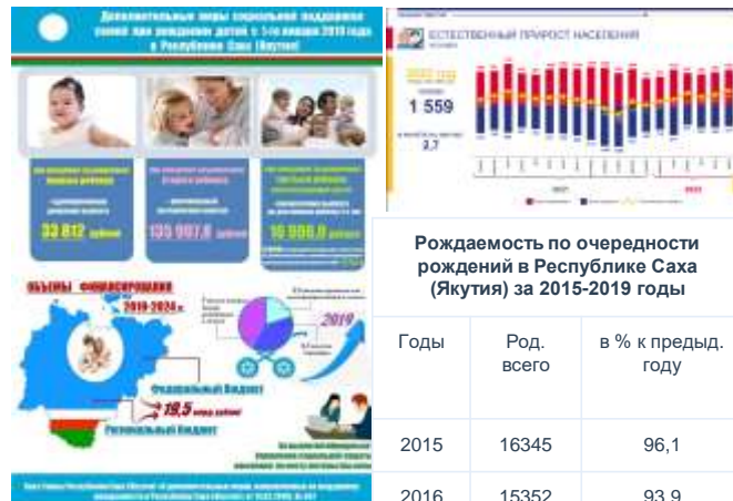
Рождаемость по очередности рождений в Республике Саха (Якутия) за 2015-2019 годы

Указ Главы Республики Саха (Якутия) "О дополнительных мерах, направленных на поддержку рождаемости в Республике Саха (Якутия)"